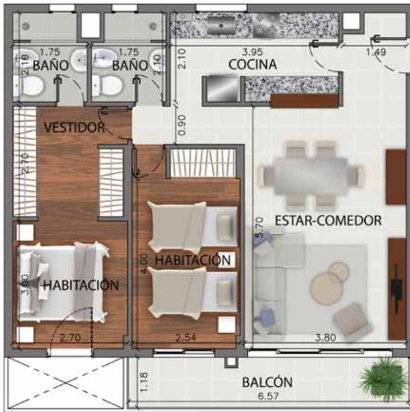
Departamentos B del piso 1º al 11º SUPERFICIE TOTAL 88.15M 2